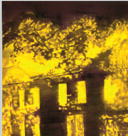
Dieter Mammel , Brennendes Haus Tusche auf Leinwand, 190 * 135, 2012