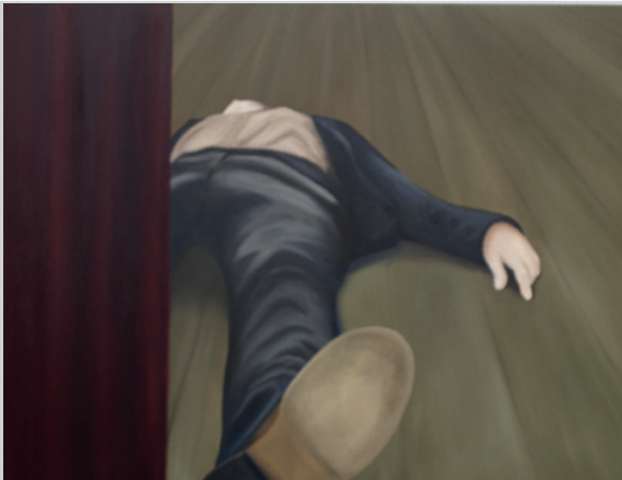
Inge Buschmann , Tatort, Öl auf Leinwand, 80 cm * 90 cm, 2009