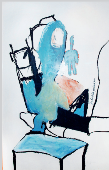
Ulrike Beckmann , Geschichten , Geschichten, Öl auf Fotokarton, 100 cm * 70 cm, 1992